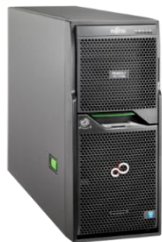
PRIMERGY TX1330 M1