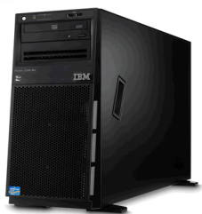
System x3300 M4 model PAW Express

CPU メモリ/光学ドライブ HDDインターフェイス/HDD構成 RAIDレベル/ほか OS 保証